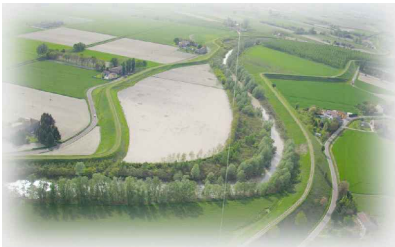
B.1.9 - Intervento di ripristino spondale in corrispondenza dello stante sx 240 e sx 241

Adeguamento strutturale e funzionale del sistema arginale difensivo tramite interventi di adeguamento in quota ed in sagoma a valle della cassa fino al confine regionale per garantire il franco di 1 metro, rispetto alla piena di TR 20 anni nello stato attuale, e la stabilità e resistenza dei rilevati (MO-E-1323)